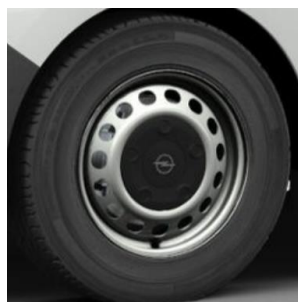
16" ocelové disky