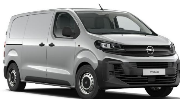
Šedá Kontrast (F4M0) 600 €