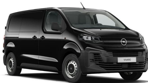
Čierna Karbon (9VM0) 600 €