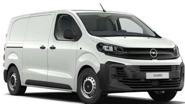
Biela Kaolin (PRPO) 0 €