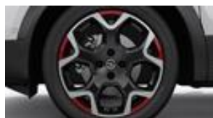
18" dvojfarebné disky z ľahkých zliatin s 5 lúčmi a červenými prvkami (ZHA3)