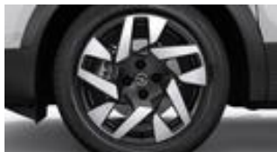
17" dvojfarebné disky z ľahkých zliatin s 5 dvojitými lúčmi (ZHP8/T9)