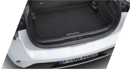
Vanička do batožinového priestoru, obojstranná Vanička s protišmykovou úpravou. Vrchná časť z čierneho koberca, spodná časť z čistiteľnej gúmy. Vysoký, stabilný okraj (30 mm) s nápisom Mokka. Číslo dielu: 9837878380 Cenniková cena: 106,81 €