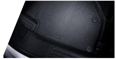
Súprava gumových tvarovaných kobercov -4ks Ochráni podlahu pred vlhkosťou, snehom a nečistotami. Nápis Mokka vpredu Číslo dielu: 1671152380 Cenniková cena: 67,63 €