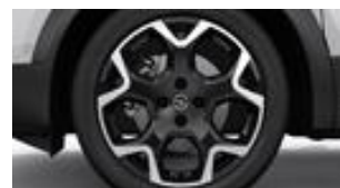
18" dvojfarebné disky z ľahkých zliatin s 5 lúčmi (ZHQ1)