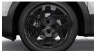
17" čierne disky z ľahkých zliatin s 5 dvojitými lúčmi (ZHP9)