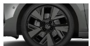
17" čierne disky z ľahkej zliatiny s výbrusom Diamond Cut (ZHQW)