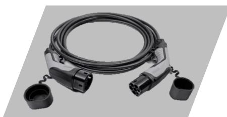
Kábel režimu 3, 6 m pripojenie do nabíjacej stanice (domácej alebo verejnej)

pripojenie do domácej zásuvky Číslo dielu: 9850525180 Cenníková cena: 420 €