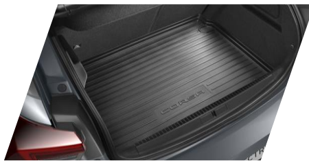
Gumová podložka do batožinového priestoru

Číslo dielu: 1646164280/ 1646164180 Cenníková cena: 36,52 € / 36,46 €