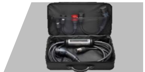
Kábel režimu 2 – Univerzálny, Súprava s nabíjacou jednotkou IC-CPD, max. 22 kW, konektor, typu 2 pre vozidlo a 3 adaptéry pre pripojenie k elektrickej sieti (Typ2+CEE16/ 3p+CEE7/7)

1 fáza-7,4 kW-32A-č.dielu: 9844681180 - 421 € 3 fázy-11 kW-3x16A-č.dielu: 9844681380 - 503 € 3 fázy-22 kW-3x32A-č.dielu: 9844681480 - 478 €