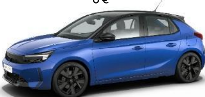
Modrá Voltaik (AVM0) 500 €