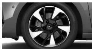
16" čierne disky z ľahkej zliatiny s výbrusom Diamond Cut (ZHU1)