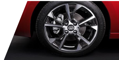
Disk z ľahkej zliatiny 17", 5 lúčov

Číslo dielu: 1613700380 Cenníková cena: 98,86 €