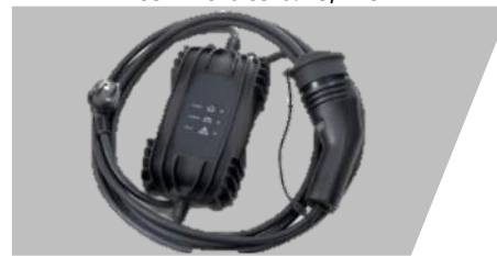
Kábel režimu 2 – typ EF, 1 fáza – 8 A – 6 m,

Pre pneumatiky: 205/45R17. Rozmery: 7Jx17 Číslo dielu: 1646346180 Cenníková cena: 241,45 €