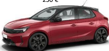
Červená Kardio (PQM0) 500 €