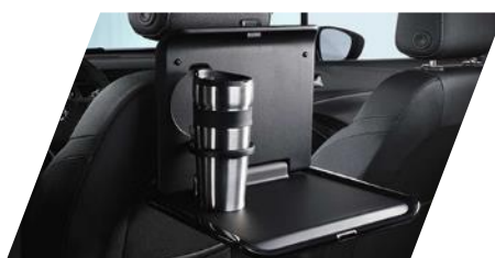
FlexConnect sklápny stolček

Číslo dielu: 9834351380 Pôvodná cena: 59,00 €