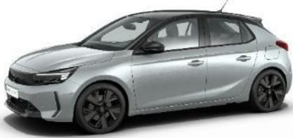
Strieborná Kristall (ZRMO) 0 €