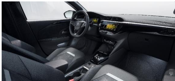
Čalúnenie Alcantara, čierne Jet Black, sedadlo vodiča s bedernou opierkou a masážnou funkciou, vyhrievané predné sedadlá a vyhrievaný volant (1UFX) 0 €