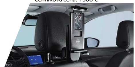
FlexConnect držiak tabletu (univerzálny)

potrebné objednať FlexConnect adaptér Číslo dielu: 9834352980 Cenníková cena: 177,11 €