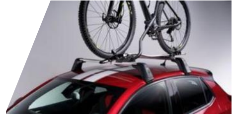
Strešný nosič bicykla Thule "Expert 298"

Rozmery: 1 330 x 860 x 370 mm. Objem: 320 l Číslo dielu: 1662444280 Cenníková cena: 289,37 €