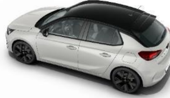
Čierna strecha Diamond Black (JD20) GS štandard