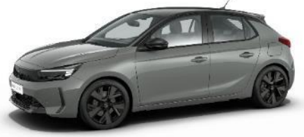
Šedá Grafik (SDP0) 500 €