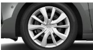
16" ocelové disky s krytmi v striebornej farbe (ZHHU)