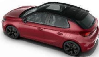
Presklenná strecha so slnečnou clonou (OK01) 800 €