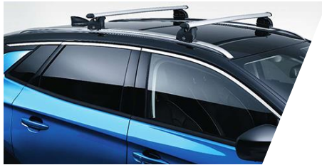
Základný nosič hliníkový Sada 2 tyčí.

Číslo dielu: 9833757280 Cenníková cena: 78,88 €