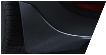
Lapače nečistôt (zásterky) predné/zadné

Číslo dielu: 1646164280/ 1646164180 Cenníková cena: 36,52 € / 36,46 €