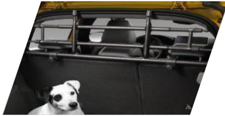
Univerzálna ochranná mreža pre psov, plast

9 mm snehová reťaz z odolnej ocele so zaskakovacím zámkom, 2 snehové reťaze, vhodné pre 185/65 R15 a 195/55 R16 Číslo dielu: 1623144780 Cenníková cena: 79,22 €