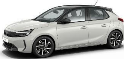
Biela Arktis (WPP0) 250 €