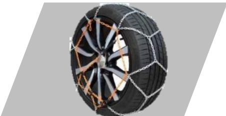
Snehové reťaze POLAIRE XP9 (veľ. 070) -2ks

Číslo dielu: 9858801180 Cenníková cena: 327,74 €