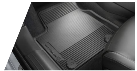
Celoročné podlahové rohože – čierne, 4ks

Číslo dielu: 1668247380 Cenníková cena: 101,51 €