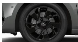
16" čierne disky z ľahkej zliatiny (ZHL5)