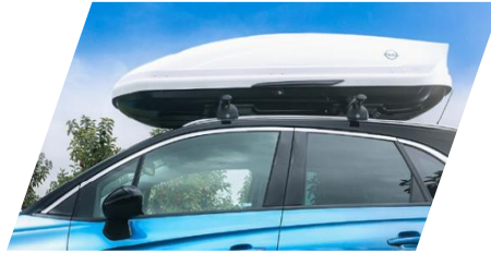
Strešný box Thule "Ocean 80,"

model so strešnými ližinami / bez strešných ližín Číslo dielu: 13474370 / 13474372 Cenníková cena: 342,23 € / 430,79 €