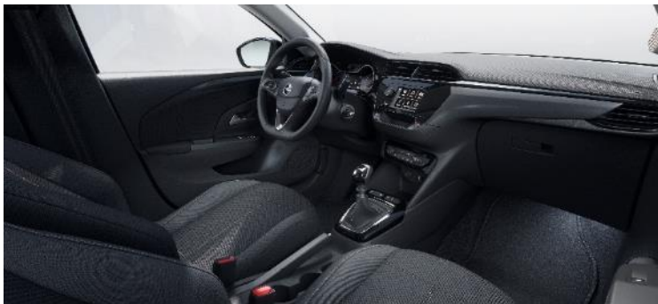
Komfortné sedadlá, látkové čalúnenie čierne Fresez, sedadlo vodiča nastaviteľné v 6 smeroch (BPFX) 0 €