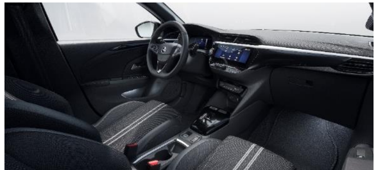
Látkové čalúnenie Banda, čierne s bielymi pruhmi, športové tvarovanie sedadiel (D4FV) 0 €