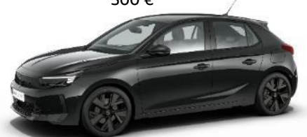
Čierna Karbon (9VM0) 500 €