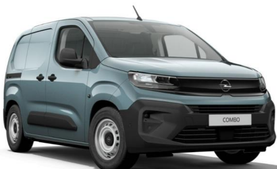
Modrá Kiama (M6M0) 450 €