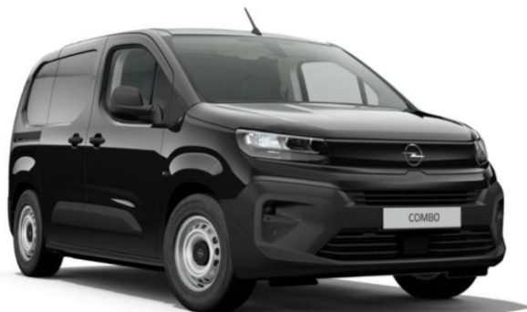
Čierna Karbon (9VM0) 460 €