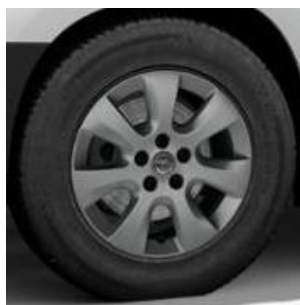
16" disky z ľahkej zliatiny (DZSD) 680 €