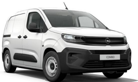
Bielea Kaolin (PRPO) 0 €