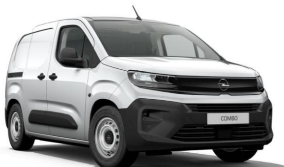
Šedá Kontrast (F4M0) 450 €