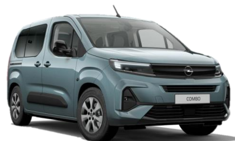
Modrá Kiama (M6M0) 500 €