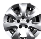
16" x 6,5 disky z ľahkej zliatiny Viana (DZSD)