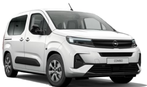
Biela Kaolin (PRPO) 0 €